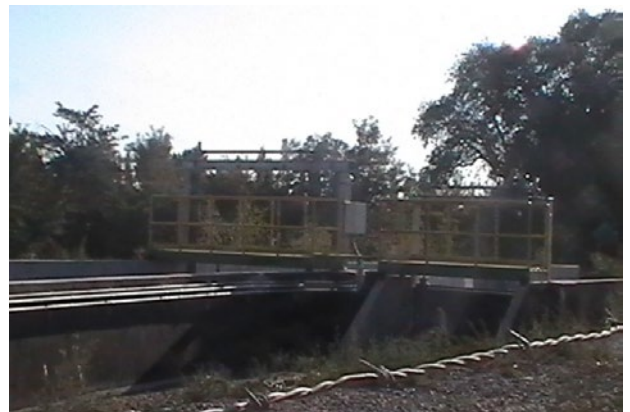
Vista general instalación