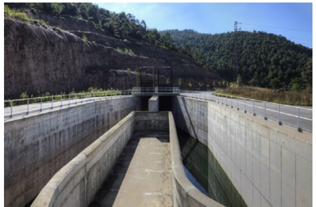
Vista del Tramo III del Canal Segarra-Garrigues