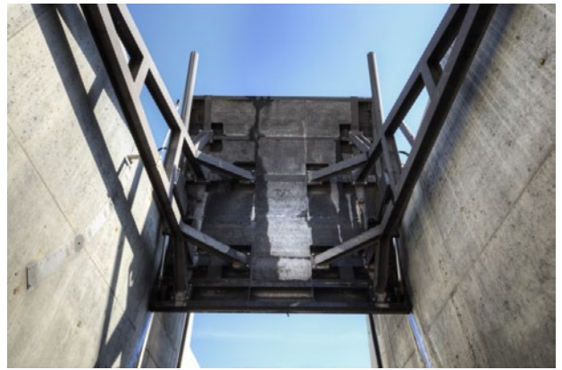
Compuerta Taintor del Tramo III realizada por COUTEX

La tipología de compuertas es la siguiente: 13 Compuertas Murales, 5 Compuertas Murales Vagón 3 Compuertas Canal Vagón, 8 Compuertas Taintor y 12 Ataguías.