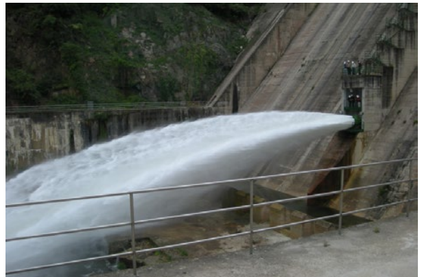
Pruebas de válvulas.