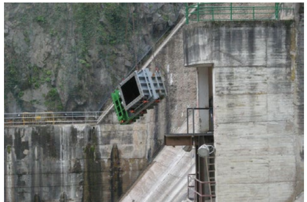
Montaje de válvulas.