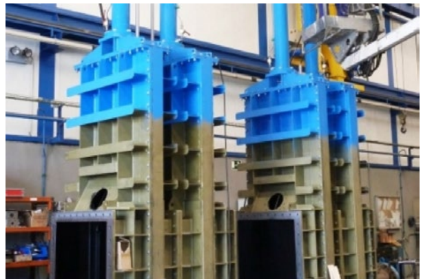
Pruebas de válvulas Bureau en taller

Construcción de una caseta de 3,80 x 3,80 x 2,50 m. para alojamiento de los sistemas de mando y control y colocación de barrera flotador en el embalse.