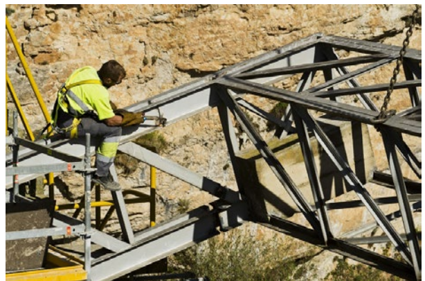
Desmontaje de compuertas Taintor de aliviadero.